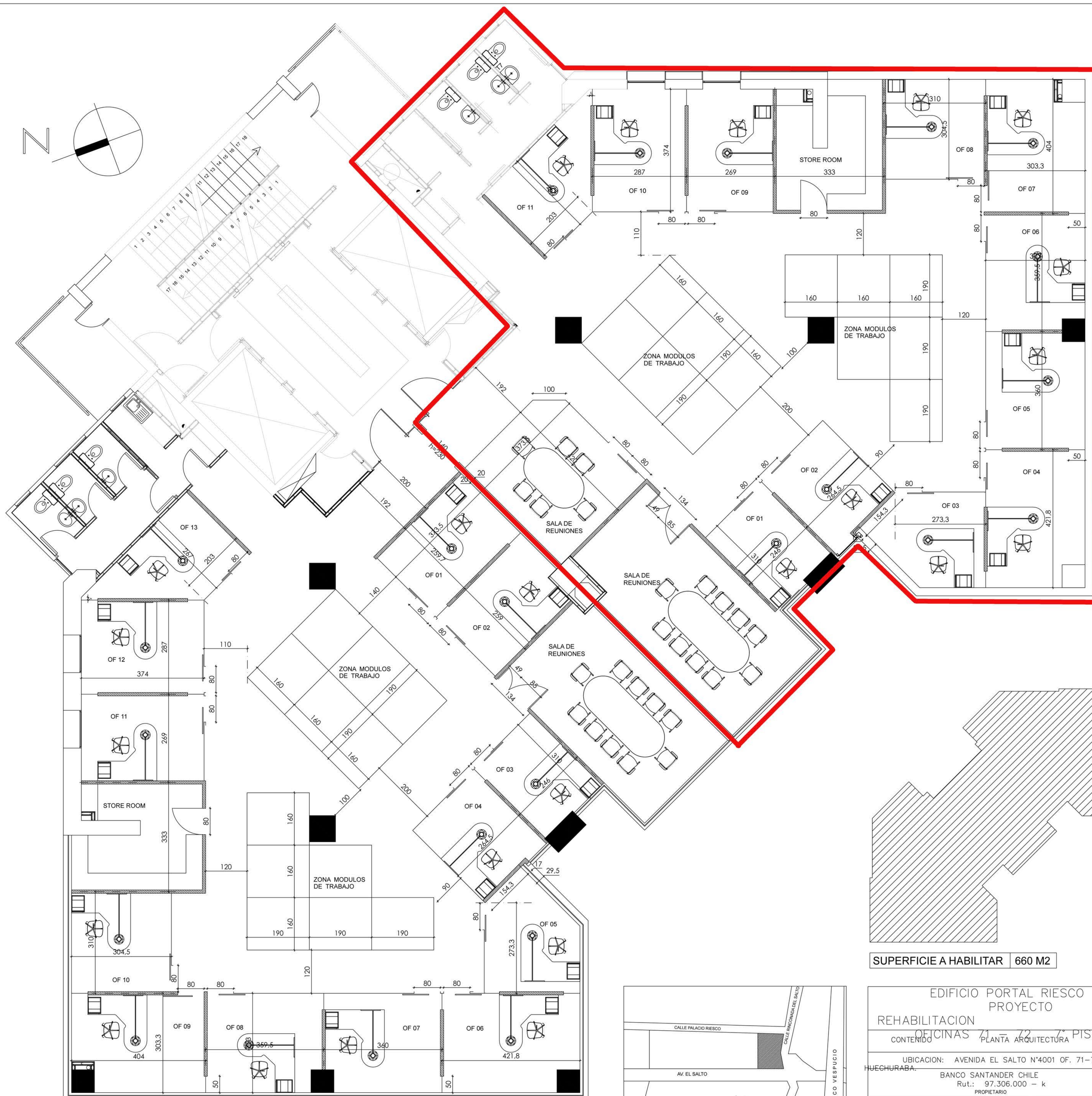
PLANTA 7º PISO Esc 1:50